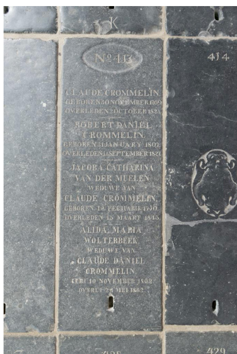
Příklad č. 3