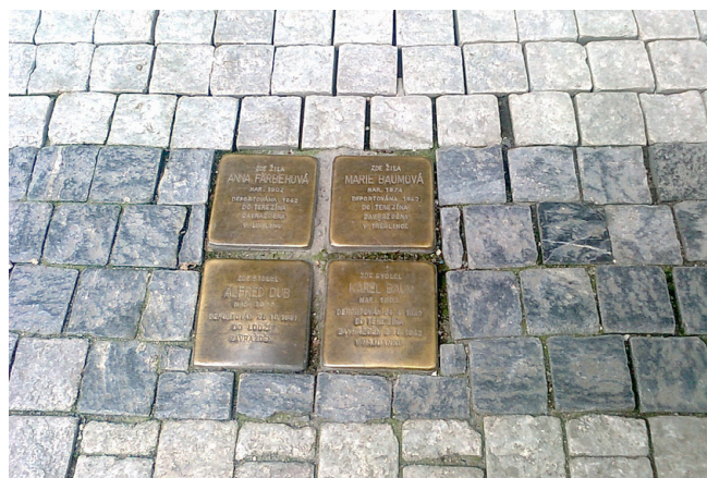
Příklad č. 2