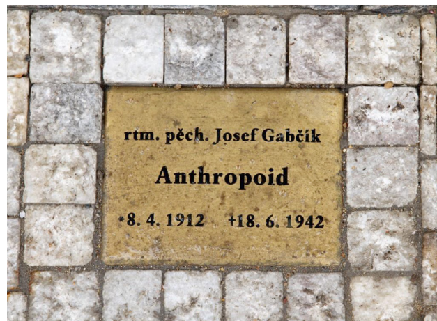
Příklad č. 1

Národní památník hrdinů heydrichiády doplnění památníku parašutistům - vykonavatelům atentátu na Reinharda Heydricha v uličním prostoru. Cedulky se jmény hrdinů jsou přímo v chodníku. Prostor si cedulka se jménem nevynucuje sama - skloněný voják s dítětem (viz foto.), květiny a svíčka dotvářejí "živý" památník.