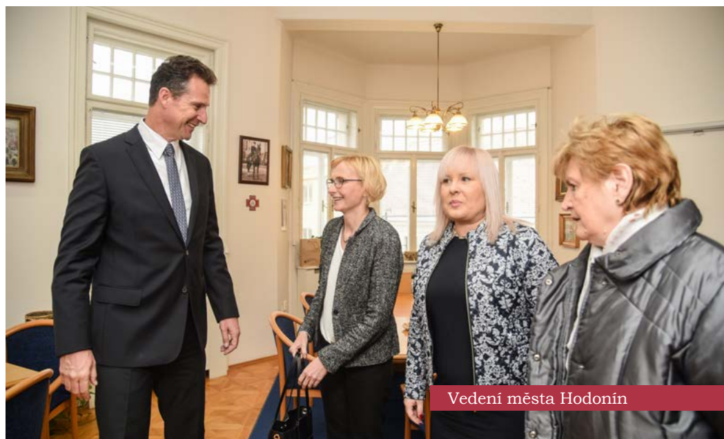
Vedení města Hodonín

Pane předsedající, paní komisařko, systémy elektronického mýtného by měly být schopny spolupracovat s dalšími systémy a měly by být založeny na otevřených a veřejných normách, které jsou bez diskriminace dostupné všem dodavatelům systémů. Systém výběru poplatků za užívání pozemních komunikací by měl být jednoduchý, spravedlivý a neměl by diskriminovat řidiče z jiných členských států. Do výše poplatků by se přitom měla objektivně promítnout míra vlivu vozidla na životní prostředí, jakož i na technický stav pozemní komunikace. Jsem velmi ráda, že se podařilo prosadit, aby bylo možné používat jednu palubní jednotku ve všech členských státech. Tím odpadne nutnost pořizovat si pro cestování v Unii jednotlivé krátkodobé dálniční známky. Přestože nebyly do směrnice o spolupráci elektronických systémů pro výběr mýtného a usnadnění přeshraniční výměny informací zapracovány všechny moje požadavky, považuji konečný výsledek za rozumný kompromis a děkuji za něj ze strany Evropského parlamentu, především panu zpravodaji.