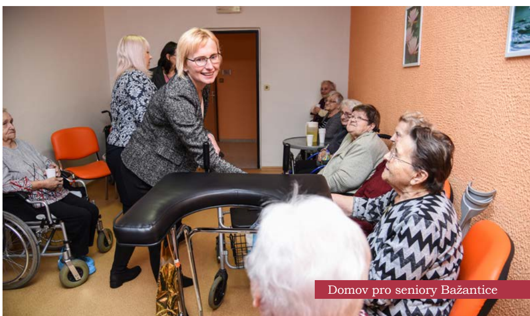
Domov pro seniory Bažantice